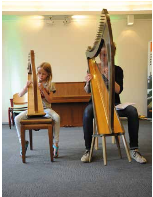
Muziekhuis Deventer

Leden die ideeën hebben om hun organisatie te betrekken bij een proeftuin kunnen dat kenbaar maken via m.gerrits@ntb.nl . Wordt vervolgd!