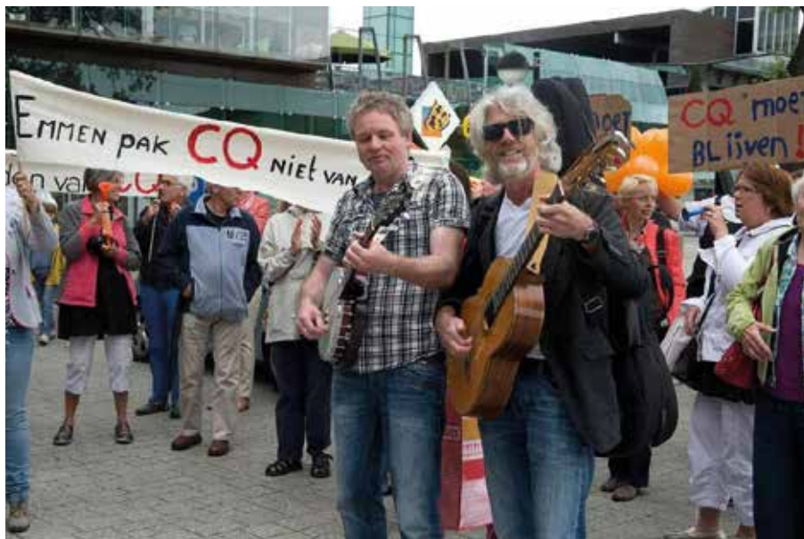
Demonstratie voor het behoud van CQ in Emmen, foto: Dagblad van het Noorden

De wethouders van de gemeenten Emmen en Coevorden werden in augustus 2016 aangeschreven om in een gesprek een minnelijke oplossing te realiseren ... zij gaven niet thuis. In november 2016 zijn alle raadsleden via email benaderd met een uitnodiging om kennis te nemen van feiten in het – inmiddels gegroeide – dossier. Velen zijn genodigd, zeer weinigen wensten tijd vrij te maken. De politici die wel kwamen waren 'geschokt'... Op onze vraag of zij mogelijk de wethouders konden bewegen om in gesprek te gaan werden wij verwezen naar het 'inspreekurtje, om zaken op de agenda te krijgen'.